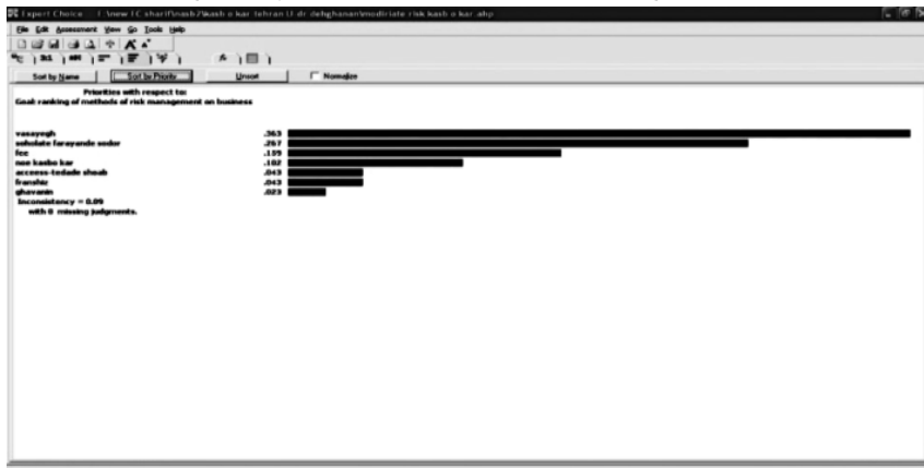
شکل ۲. اولویت‌بندی معیارها در نرم‌افزار اکسپرت چویس

دومین سؤال تحقیق این بوده که ترتیب اولویت‌بندی و اوزان گزینه‌ها (ابزارها) که در درخت تصمیم فرایند تحلیل سلسله‌مراتبی، هدف نهایی نیز است چگونه می‌باشد؟ پس از