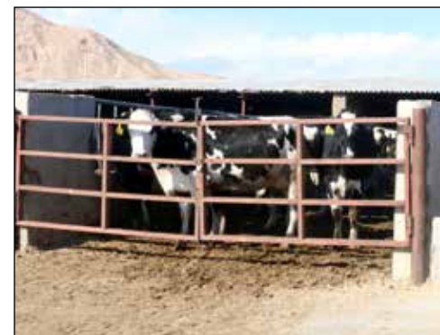
کارنامه عملکرد استان سمنان در اعطای تسهیلات اشتغال روستایی و عشایری