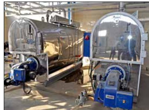
کارنامه عملکرد استان زنجان در اعطای تسهیلات اشتغال روستایی و عشایری