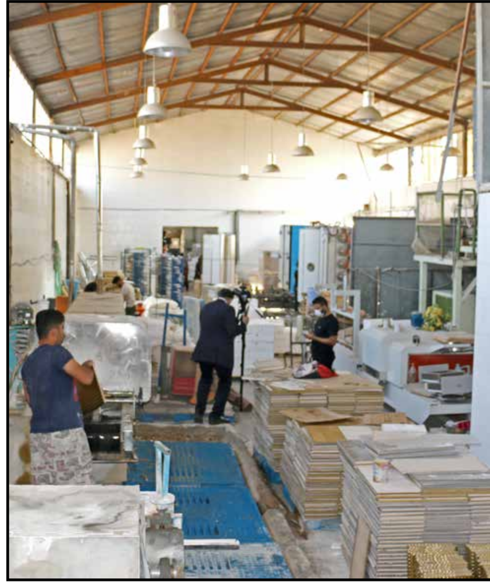
کارنامه عملکرد استان تهران در اعطای تسهیلات اشتغال روستایی و عشایری