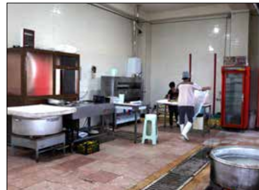
کارنامه عملکرد استان یزد در اعطای تسهیلات اشتغال روستایی و عشایری