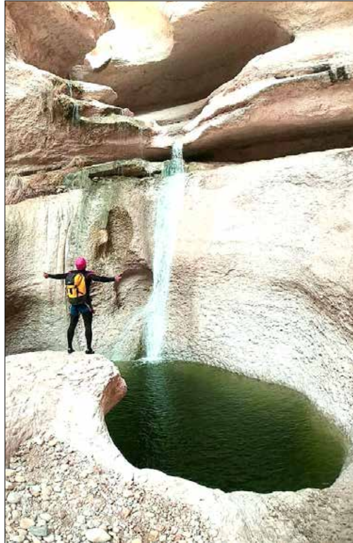
کارنامه عملکرد استان هرمزگان در اعطای تسهیلات اشتغال روستایی و عشایری

هرمزگان استانی شیلاتی است و ۵۰ درصد از جمعیت استان با پرداختن به امور شیلات و آبی کماکان در روستاها مانده اند و این نشان از ظرفیت های صیادی این استان دارد. بنا بر آمار مدیرکل شیلات هرمزگان، این استان با برخورداری از هزار و ۴۰۰ کیلومتر مرز ساحلی با بیش از چهار هزار و ۴۰۰ فروند شناور صیادی و بالغ بر ۲۹ هزار نفر صیاد نقش کلیدی در صید و صیادی کشور دارد. هرمزگان با بیش از ۲۲۰ هزار تن صید سالانه، به تنهایی ۳۶ درصد صید کشور را در اختیار دارد و دارای بالاترین میزان صید در آب های آزاد کشور است. هرمزگان با برخورداری از ۲۲ بندر صیادی و صید بالغ بر ۹۲ درصد ماهیان سطح زی ریز کشور در این دو شاخص نیز رتبه اول و رتبه دوم تولید میگوی پرورشی کشور را دارد. بنا بر آمار قائم مقام رئیس سازمان شیلات ایران و مجری طرح ماهی در قفس سازمان شیلات ایران موافقت اصولی ۲۵۰ هزار تن پرورش ماهی در قفس در کشور صادر شده است و هرمزگان با داشتن سهمی حدود ۹۰ هزار تن محور اصلی پرورش ماهی در قفس کشور است. ارقامی که ارائه شدند نشان دهنده اهمیت نقش صیادی و شیلات در استان هرمزگان