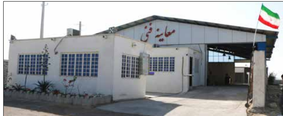
کارنامه عملکرد استان هرمزگان در اعطای تسهیلات اشتغال روستایی و عشایری