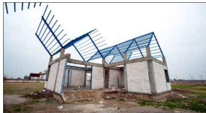
کارنامه عملکرد استان گلستان در اعطای تسهیلات اشتغال روستایی و عشایری