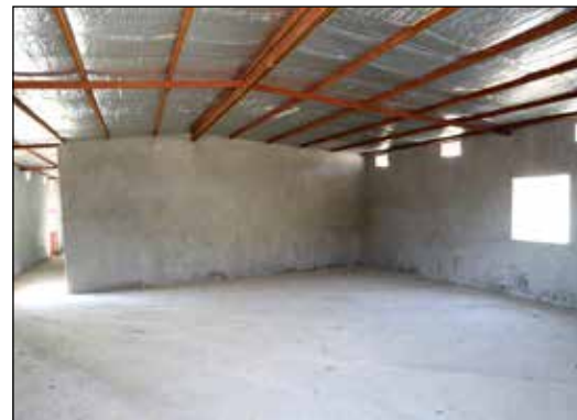
کارنامه عملکرد استان کهگیلویه و بویر احمد در اعطای تسهیلات اشتغال روستایی و عشایری